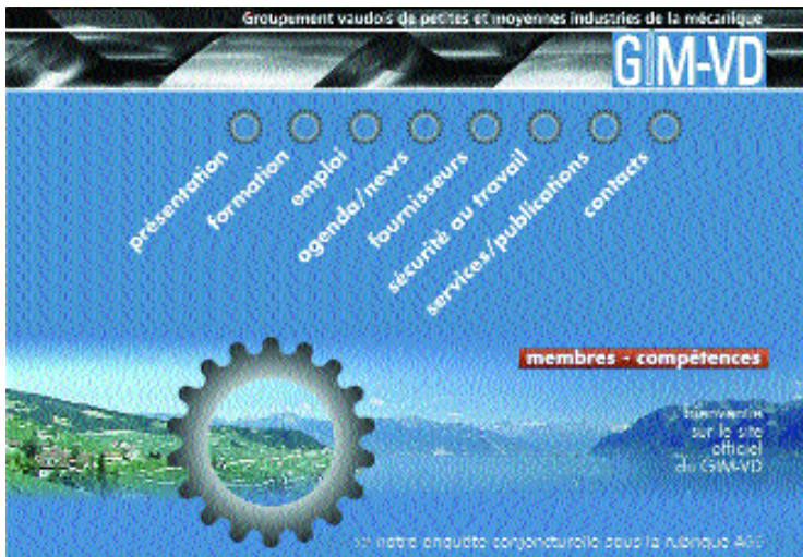
La page d'accueil de www.gim-vd.ch avec une splendide vue du Lavaux, épice centre du GIM-VD