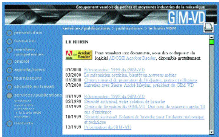
Ce site recèle aussi tous les articles du Burin, ayant paru dans le MSM, en format PDF