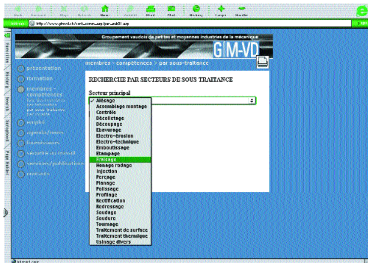
Un moteur de recherche intuitif où les choix sont simples à comprendre